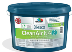
CleanAir NA 2