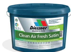
CleanAir Fresh Satin