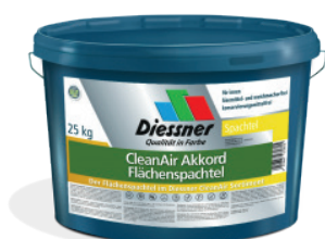
CleanAir Akkord Spartel