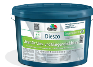
CleanAir Filt- og Vævklaeber