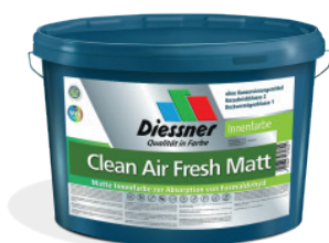
CleanAir Fresh Mat