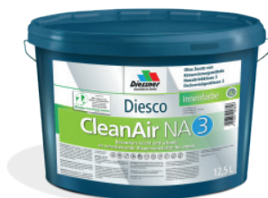
CleanAir NA 3