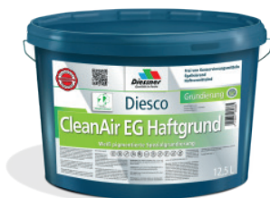
CleanAir EG Haftgrund