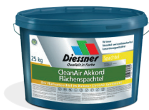
CleanAir Akkord Spartel