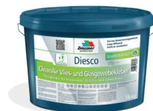
CleanAir Filt- og Vævklaeber