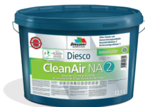
CleanAir NA 2