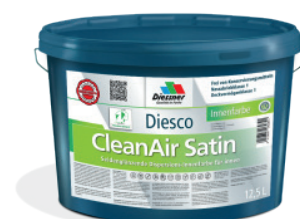
CleanAir Satin vægmalning